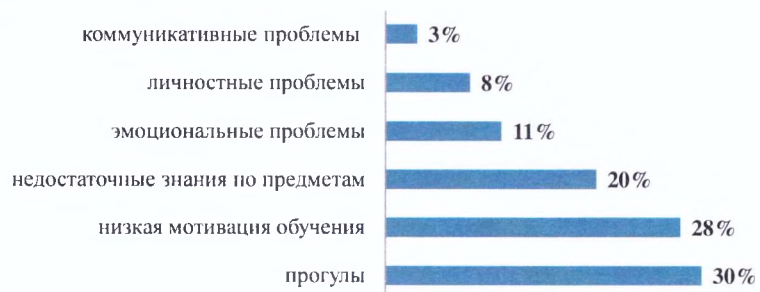
Рисунок 1. «С какими проблемами приходят выпускники детских домов и коррекционных школ?»

выпускники детских домов и коррекционных школ?» ответы распределились следующим образом: