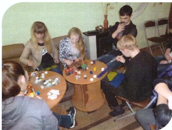
На занятиях у педагога-психолога

На занятиях обучающиеся тренируют навыки эмоциональной саморегуляции; учатся способам преодоления неуверенности в себе и сохранения суверенитета личности. Упражнения тренингов направлены на формирование профессионально важных коммуникативных и деловых качеств; развитие социального интеллекта и самооценки; воспитание активности и критичности мышления; коррекцию негативных социальных установок.