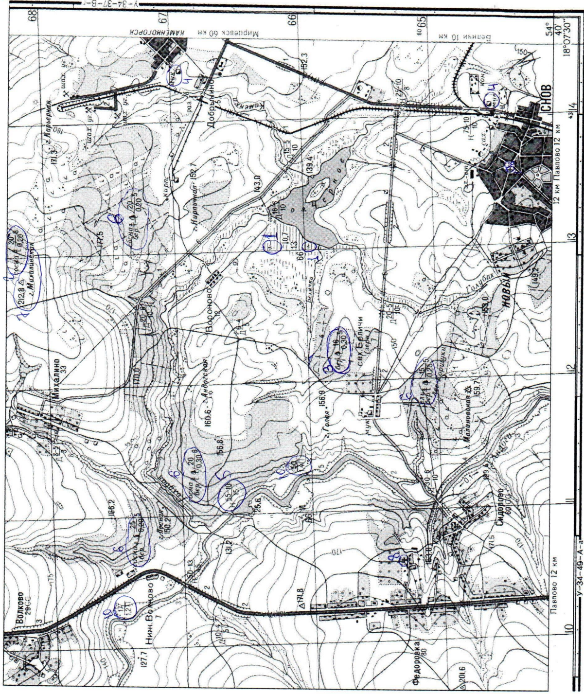
Фрагмент учебной топографической карты